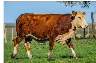
Receptora prenha de embrião.