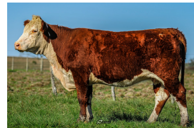
Receptora prenha de embrião.